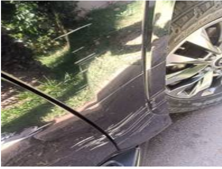
Aile avant droite (Rayure)